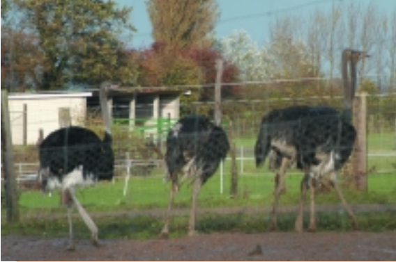
Zäune bedeuten ständige Verletzungsgefahr