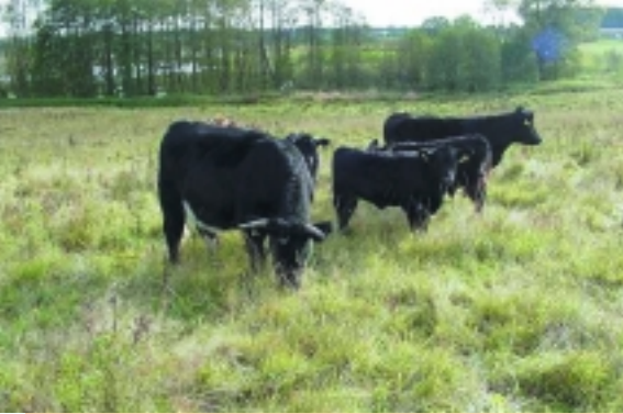
Rinder als »Landschaftspfleger«