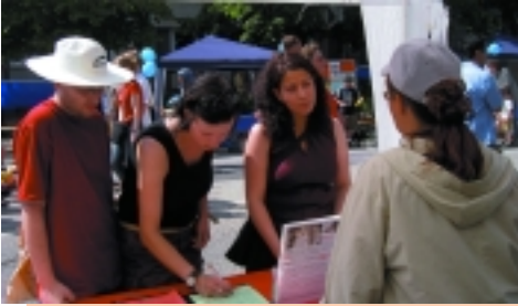
»Verbraucheraufklärung am Infostand«