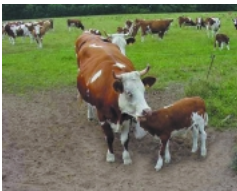
Geborgenheit bei der Mutter