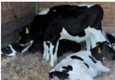
enthornte Kälber in Gruppenhaltung