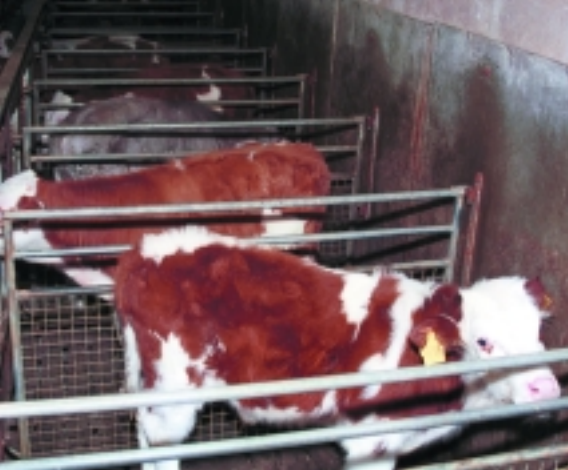
Kälber in Einzelboxen