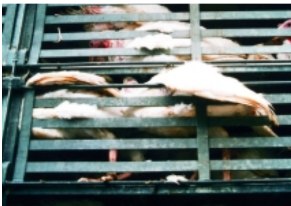
Knochenbrüche als Folge unsachgemäßen Transports