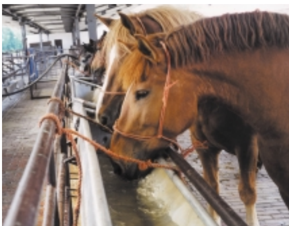
Pferde auf einem Rasthof