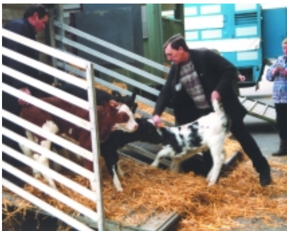
Kälber werden verladen