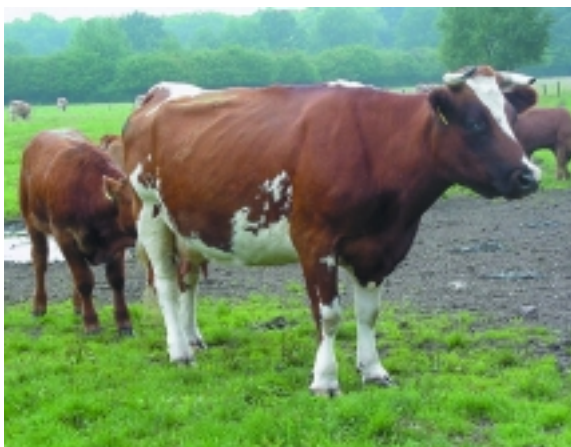
Mutterkuhherde auf der Weide