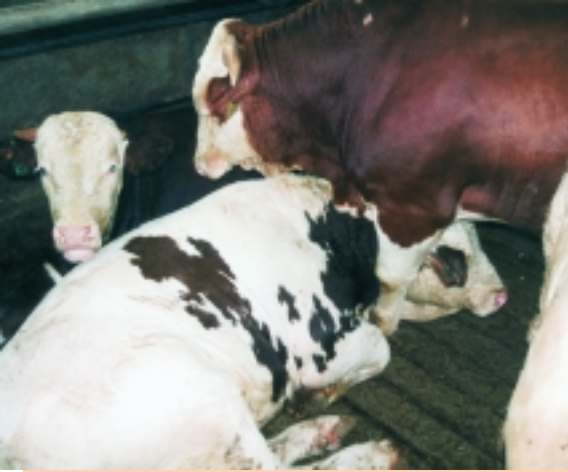
Spaltenboden — Toilette und Ruheplatz zugleich