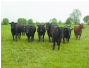
extensive Haltung von Angus-Rindern