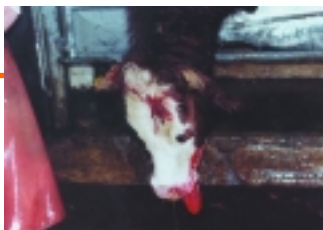
Rind nach Bolzenschuss