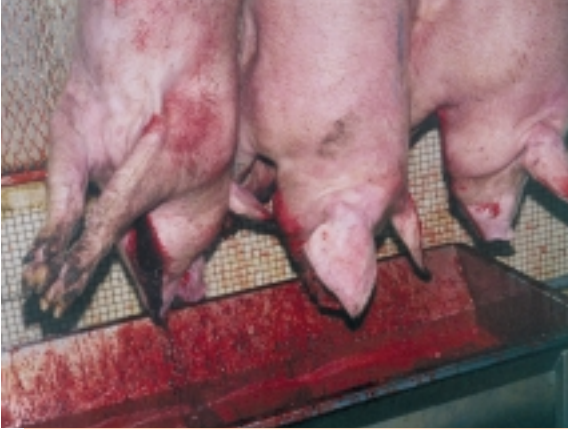
Schlachten im Akkord